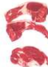
Chuleta de bistecs para freír y asar a la parrilla