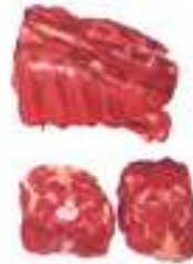
Punta o pescuezo para brasear o guisar