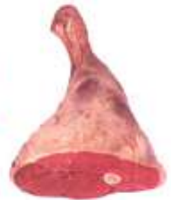
pierna para asar